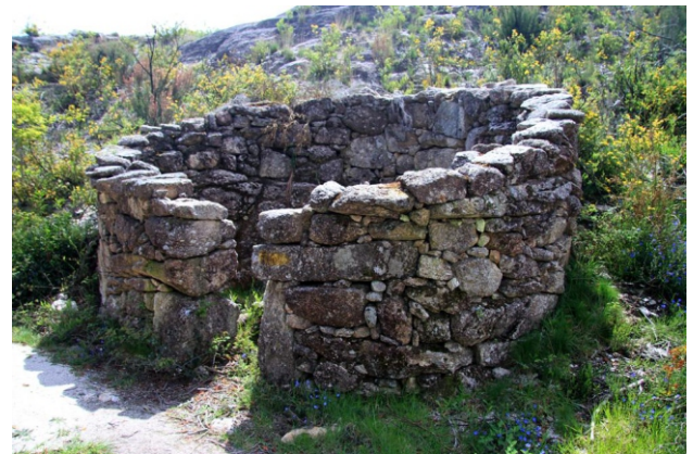
Silha do Urso en Lapela