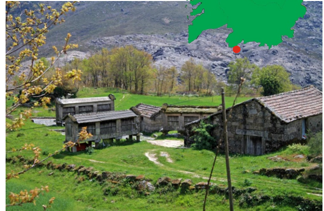
Espigueiros en Cella